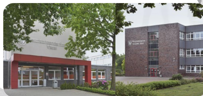
Gestaltung: Matthias Langer, Varel

E-Mail: info@bbs-varel.de Homepage: www.bbs-varel.de